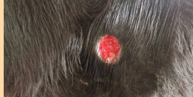
गिर्खा फुटेपछिको घाउँ