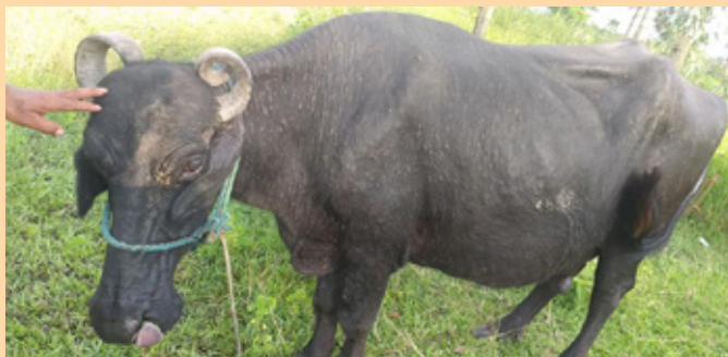
भैंसीको शरीरभरि साना साना गिर्खाहरू देखिएको