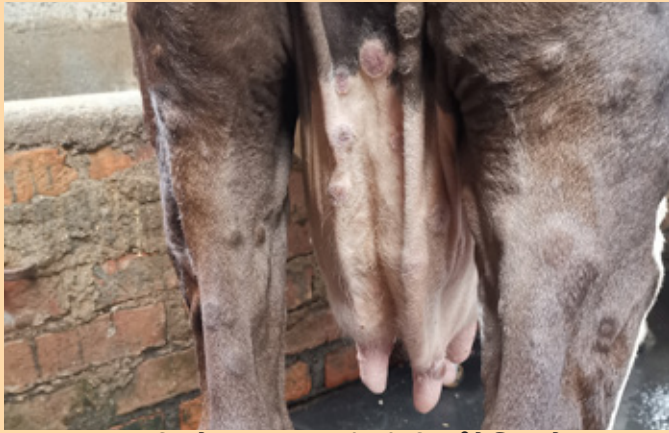
पछाडिको भाग र थुन वरिपरि गिर्खा देखिएको