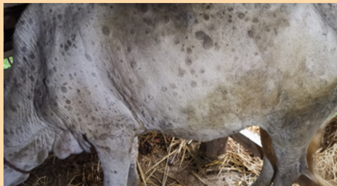
शरीरभरि गिर्खा देखिएको गाई